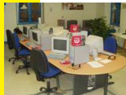
accès Internet haut débit

Association Loi 1901 déclarée en Préfecture du Doubs