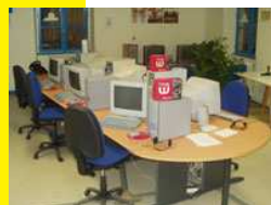
accès Internet haut débit

Association Loi 1901 déclarée en Préfecture du Doubs